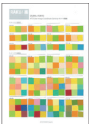
色々なイメージの配色をトレーニング！