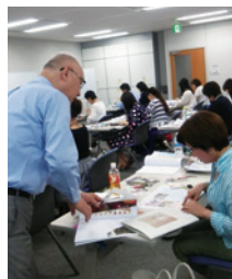
講師からの具体的な指導