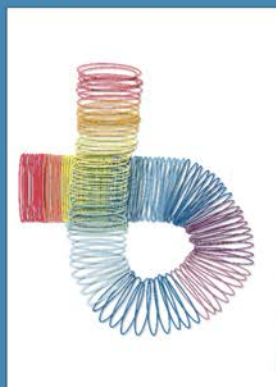
〈 前回の受賞作品 〉

※ 特別賞受賞作品は、2020年の色彩検定の広報用素材として採用させていただきます。また、デザインの採用にあたり、色彩検定協会にてアレンジさせていただく場合があります。