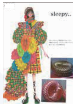
色彩検定協会特別賞